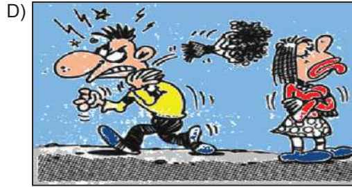
Fazla naz âşık usandırır.