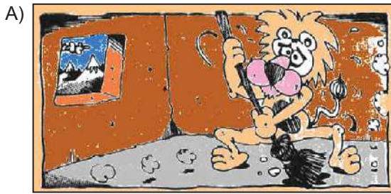
Aslan yattığı yerden belli olur.

Aşağıdaki görsellerden hangisi "Yararlı eserler veren bilgi ve erdemle donanmış kimse, alçak gönüllü olur." anlamına gelen atasözünü anlatmak için kullanılabilir?