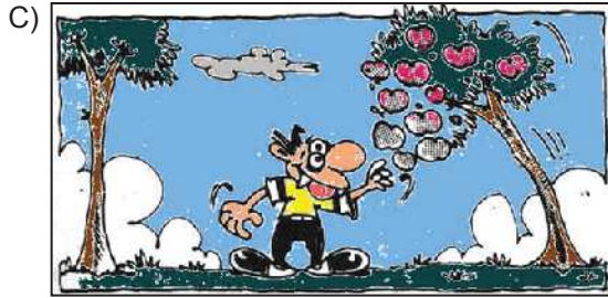
Ağacın meyvesi olunca başını aşağı salar.