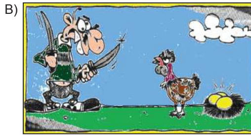
Altın eli bıçak kesmez.